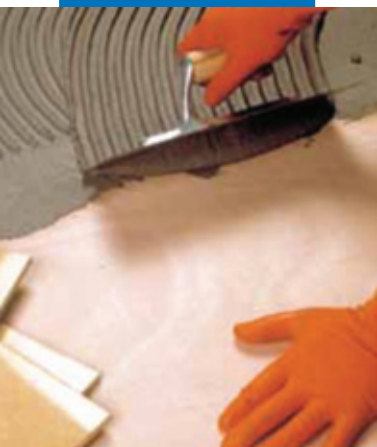
Укладка керамогранита на судостроительную фанеру с применением Elastorapid