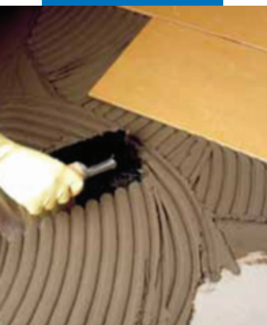
Нанесение Elastorapid на цементную стяжку посредством зубчатого шпателя