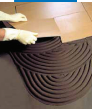
Укладка керамогранита на гидроизоляцию Mapelastic