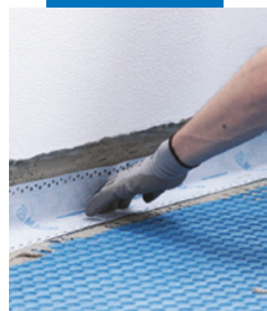
Гидроизоляция по краям с помощью Mapeband Easy на Mapeguard WP Adhesive