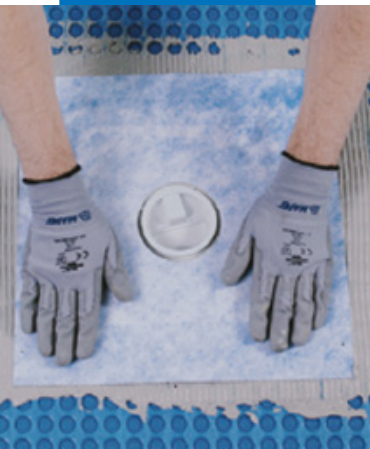
Гидроизоляция дренажных отверстий Drain Vertical/Drain Lateral