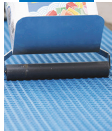
Прикатывание Mapeguard UM 35