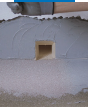
Гидроизоляция дренажных отверстий Drain Front