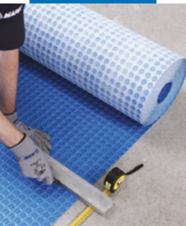
Резка Mapeguard UM 35