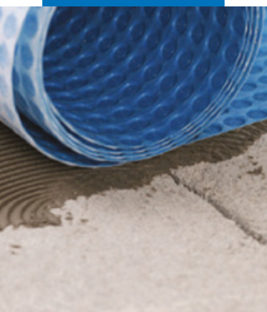
Укладка Mapeguard UM 35 Укладка Mapeguard UM 35