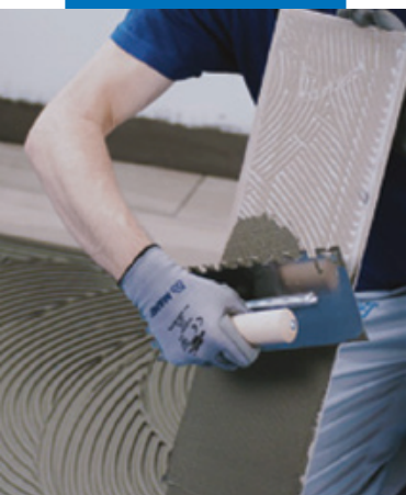
Укладка керамической плитки или камня на подходящий клей MAPEI класса не ниже С2