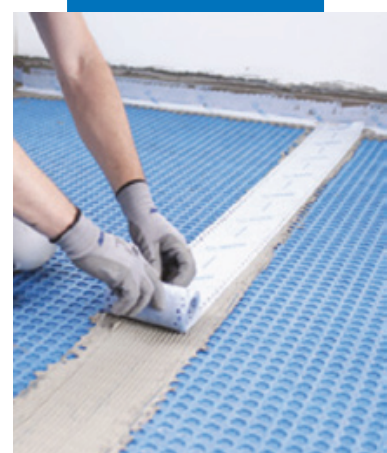
Гидроизоляция швов между листами с помощью Mapeband Easy на Mapeguard WP Adhesive