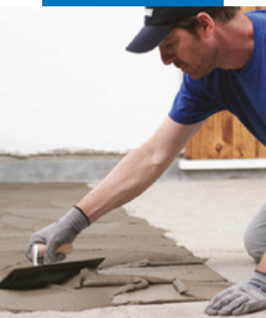
Нанесение клея зубча- тым шпателем №5